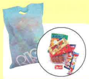
駄菓子詰め合わせ

ご来場されたお客様に 記念品をいずれかひとつプレゼントいたします*。 裏面の「 ご来場予約申込書 」に 必要事項を記入して、FAXにてご返信ください。